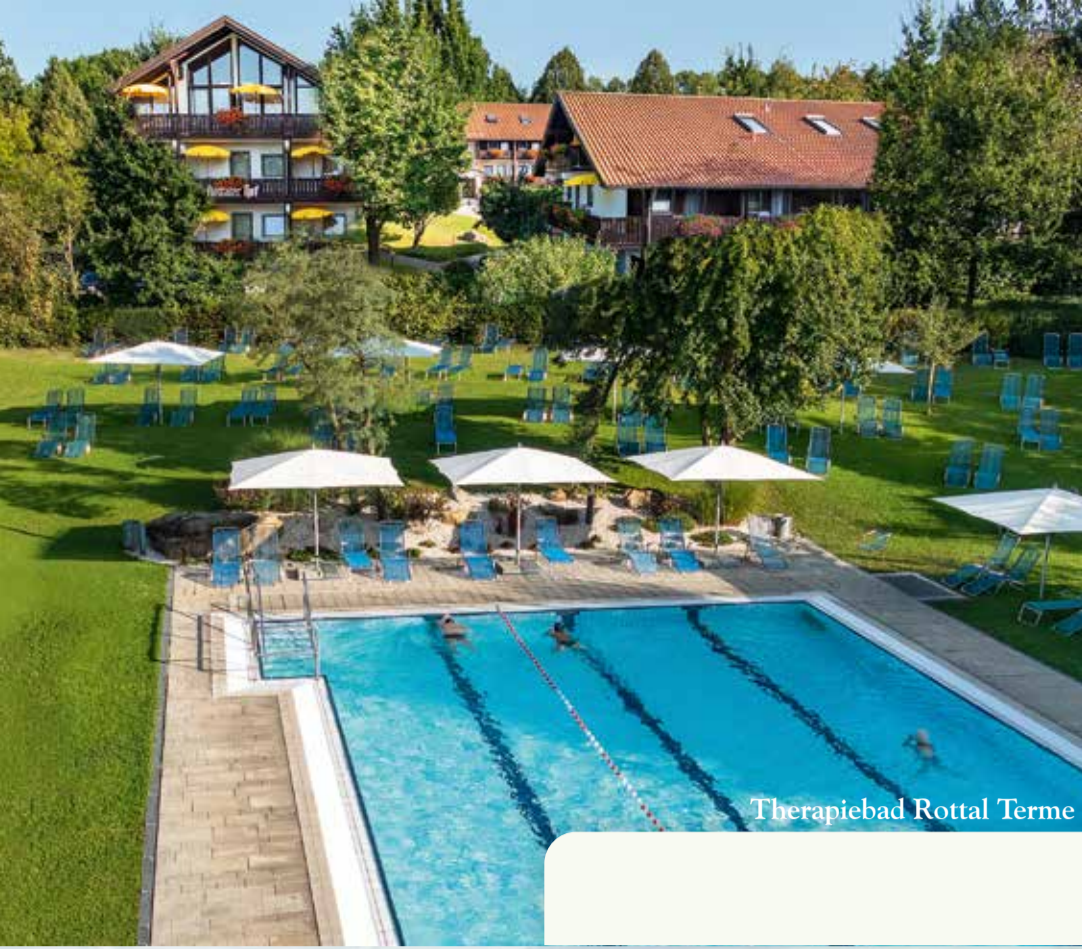
Therapiebad Rottal Terme