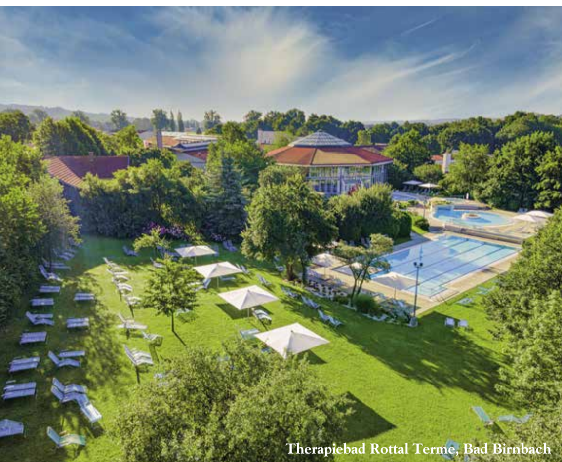
Therapiebad Rottal Terme, Bad Birnbach

14 Nächte pro Person ab DZ € 1379,- | DZ-XXL € 1484,- Komfort-DZ € 1449,- | EZ € 1484,-